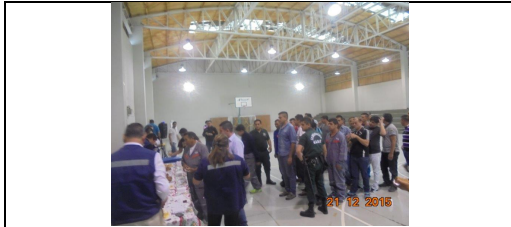
IMG. N° 001 Reinserción Social Subprograma Laboral, EP. Santiago 1.

Comentario: Con ocasión de las festividades de navidad y fin de año, con fecha 21-12-2015 la Sociedad Concesionaria brindó a los internos trabajadores dependientes, una tarde recreativa en dependencias del gimnasio donde realizaron actividades recreativas, además de disfrutar de un cocktail y presentes consistentes en artículos de higiene personal de cada uno de ellos.