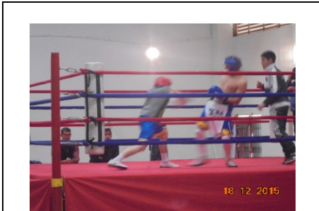
IMG. N° 003 Reinserción Social: Subprograma Deporte, Recreación, Arte y Cultura, EP Puerto Montt.

Comentario: Con fecha 18-12-2015 en dependencias del Gimnasio se realiza evento boxeril, contando con la participación de escuela de boxeo dependiente de la Municipalidad de Puerto Montt. De esta actividad participan internos de los módulos 21,51,52,53,54 y 82.