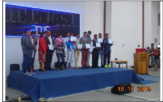
IMG. N° 002 Reinserción Social: Subprograma de Educación del Establecimiento Penitenciario Valdivia

Comentario: Con fecha 18-12-2015, se lleva a cabo licenciatura de 84 internos que cumplen exitosamente los Programas de Enseñanza Básica, Media Científico Humanista y Técnico Profesional.